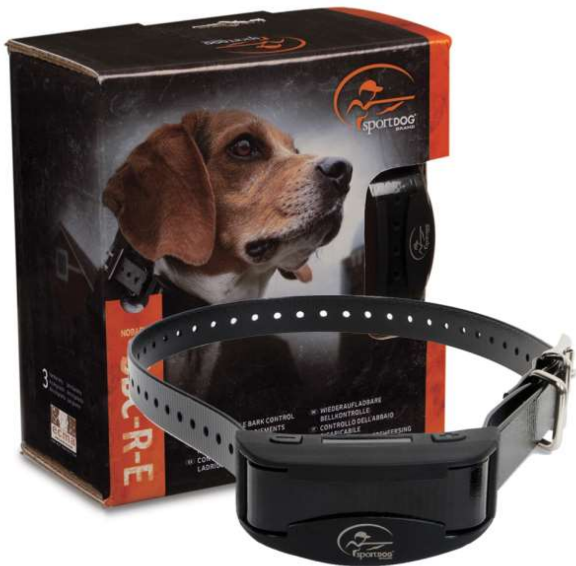
SportDog ogrlica protiv lajanja